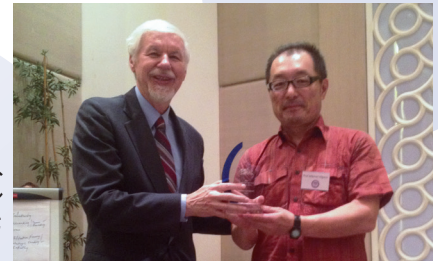
立教大学 経営学部BLPは、 WIALグローバル アワード2014を 受賞しました。