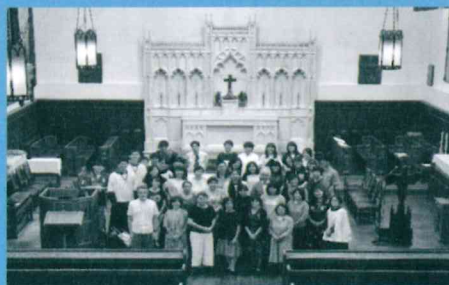
2018年度 教会音楽ワークショップ in 立教 立教学院諸聖徒礼拝堂にて

* 研究所は不在のことが多いため、お問合せやご連絡はメール、又はFaxをお願いいたします。