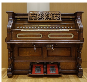
YAMAHA リードオルガン 11 ストップ